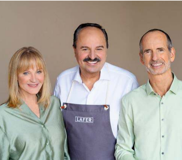
Ernährungsmedizinerin, Spitzenkoch und Schmerzspezialist – drei Experten mit einer gemeinsamen Mission: Schluss mit Schmerzen!